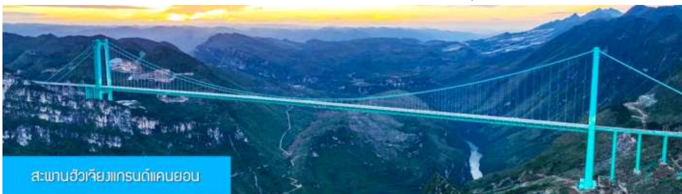
สะพานฮัวเจียงแกรนด์แคนยอน

พักที่ WINDHAM HOTEL โรงแรมระดับ 4 ดาวท้องถิ่นในเมืองอันชุ่น