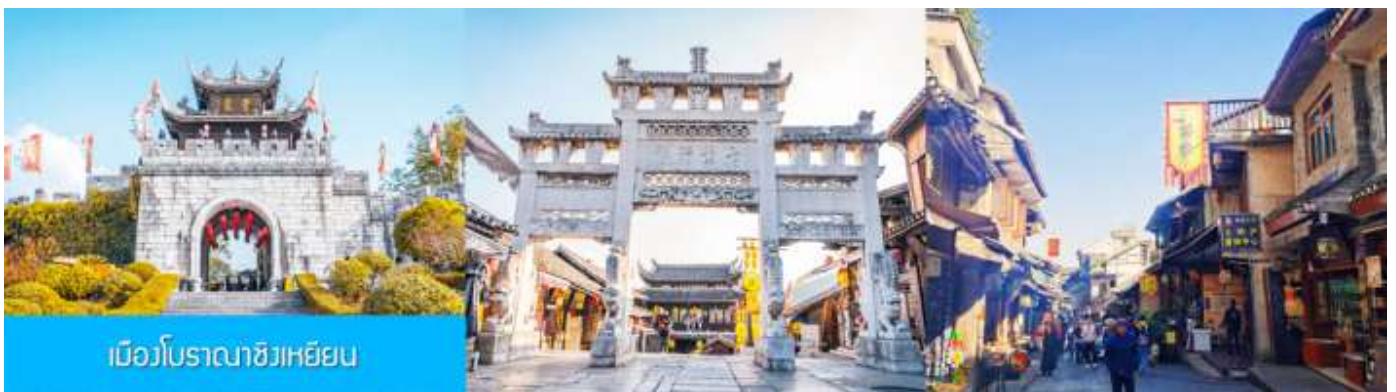
เมืองโบราณชิงเหยียน

เที่ยง รับประทานอาหารกลางวัน ณ ภัตตาคาร (มือที่ 8)