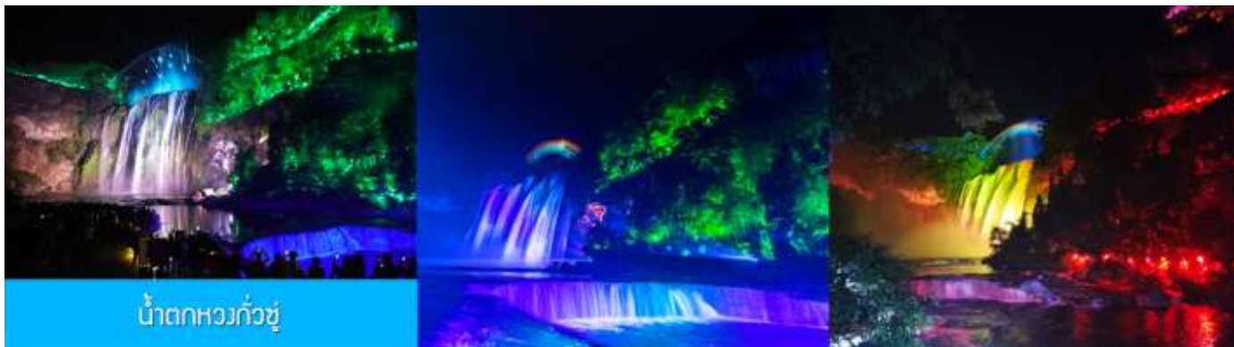
น้ำตกหวงกั๋วชู่

หลังอาหารนำท่านเที่ยวชม น้ำตกหวงกั๋วชู่ 黄果树瀑布 แหล่งท่องเที่ยวขึ้นชื่อระดับ 5A ที่ถือเป็นสัญลักษณ์ของมณฑลกุ้ยโจว เป็นหมื่นน้ำตกที่ประกอบด้วยน้ำตกน้อยใหญ่กว่าสิบแห่ง โดยมีน้ำตกหวงกั๋วชู่เป็นน้ำตกขนาดใหญ่ที่มีความสูง 74 เมตร กว้าง 81 เมตร เป็นน้ำตกหลักของอุทยาน ชมความสวยงามของน้ำตกที่ประดับด้วยแสงสีและเลเซอร์ยามค่ำคืน ที่แต่งแต้มความมหัศจรรย์แก่อุทยานแห่งนี้ (ค่าทัวร์รวมค่ารถรับส่ง รวมค่าบันไดเลื่อนขาลง และขาขึ้นภายในอุทยาน)