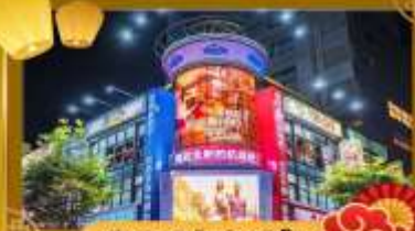
ช้อปปิ้งในไถ่บาร์เก็ด