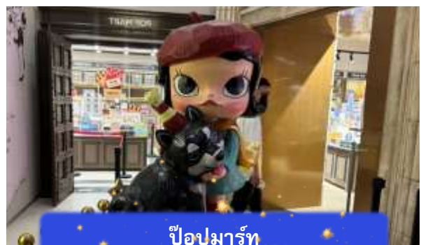
ป๊อปปาร์ท