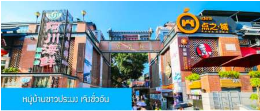
หมู่บ้านชาวประมง เจิงจ้ออัน