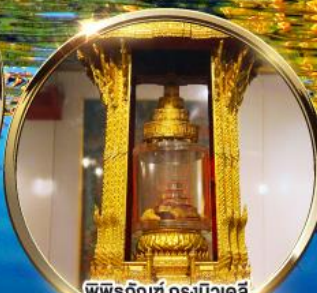
พิพิธภัณฑ์ กรุงนิวเดลี ถราบนมัสการพระบรมสารีริกธาตุ