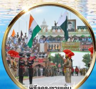
พิธีฉลองชายแดน อินเดีย-ปากีสถาน ผ่านวาทะ