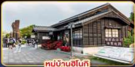
หมู่บ้านฮินกิ

"ไทเป" มหานครแห่งเมืองสีกัน เทียวจุใจ เช็กอินจุดไฮไลท์