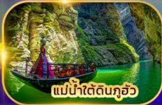
แม่น้ำใต้ดินกุ้ยโจว