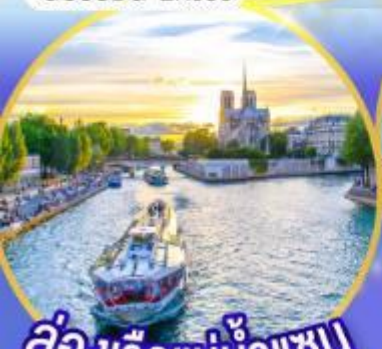
ล่องเรือแม่น้ำเซน