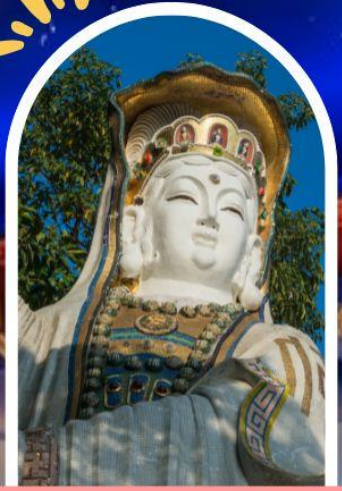
รีพลัสเบย์