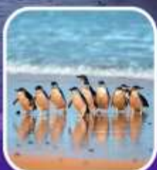
เพนกวินที่เกาะฟิลลิป

เริ่มต้น 99,900 *ราคาไม่รวม VISA ต่อท่าน บาท