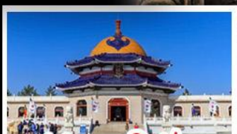
สุสานเจกิสข่าน