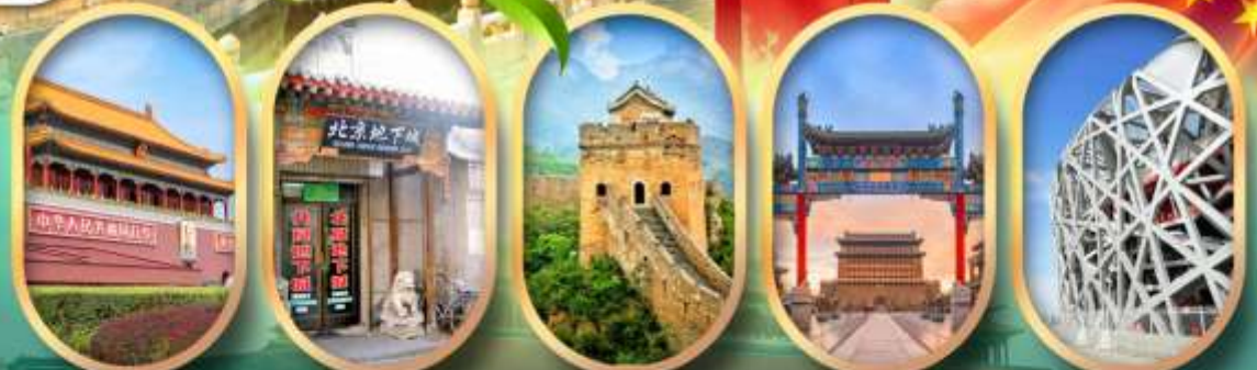
จัสมุตรีสเทียนอันเหมิน เมืองโบราณใต้ดิน กำแพงเมืองจีน ถนนคนเดินเทียนเหมิน ผ่านชมสนามกีฬาาริงนก