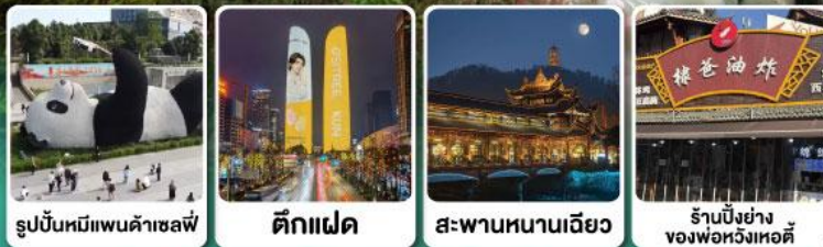
รูปปั้นหมีแพนด้าเซลฟ์ ดิ๊งเฟด สะพานหนานเฉียว ร้านปังย่างของพ่อหวังเหอติ