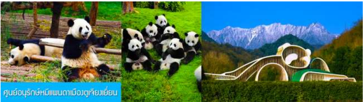
ศูนย์อนุรักษ์หมีแพนด้าเมืองตูเจียงเย็น

เช้า รับประทานอาหารเช้า ณ ห้องอาหารของโรงแรม (7) หลังอาหารท่านสามารถเลือกที่จะซื้อโปรแกรมทัวร์เสริม หรืออิสระพักผ่อนตามอัธยาศัยในโรงแรม