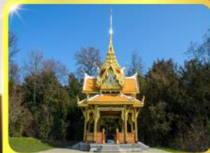
ศาลาไทยไชยาน์