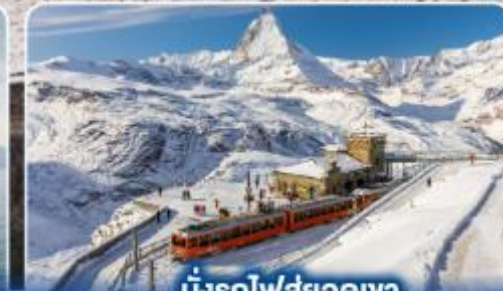
นั่งรถไฟสู่ยอดเขา กรอนเนอร์แกรด์