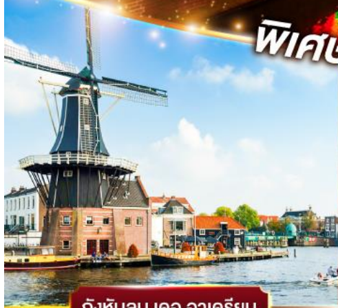
กังหันลม เดอ อาเดรียน