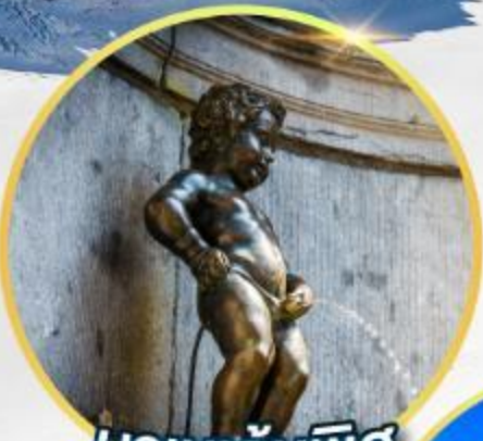
บานกันพิส