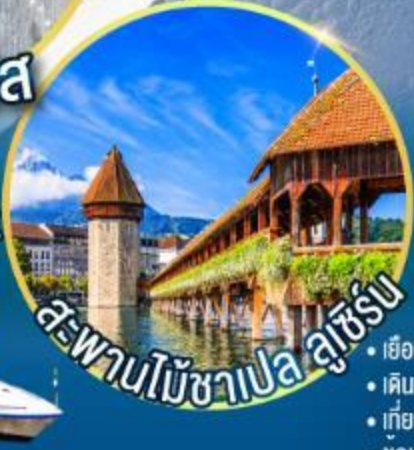
สะพานไม้ชาเปล ลูเซิร์น