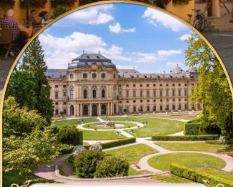
พระราชวังแวร์ซายส์ ฝรั่งเศส