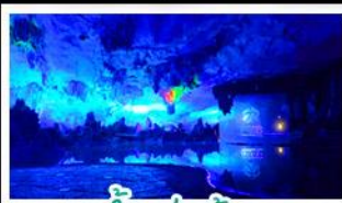
ถ้ำหลู่ซื่อ

เขารู้อี+สะพานแดง - ล่องเรือแม่น้ำหลี่เจียง นาขั้นบันไดสีทองอร่าม - กำแพงสุ่ยอ้อ - ทางวงช้าง เจดีย์เงินเจดีย์ทอง - รถไฟความเร็วสูง เมฆพิเศษ บุปผาฟ้าย่างบาร์บีคิว ปลาอบเบียร์ ฝีมือคริสตัล สุกี่เห็น