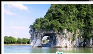
ทางวงช้าง