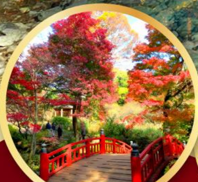
สวนดอกบ๊วยอาคาบิ