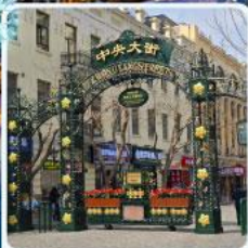
ถนนจางยาง