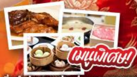
ต้มยำฮ่องกง, ห่านย่าง และอาหารชาบู