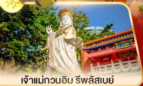
เจ้าแม่กวนอิม ธิพลสมัย