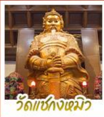
วัดเซกุงเมียว