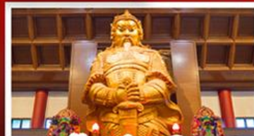
วัดเขกทมิว