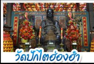
วัดบิกิตฮองฮ่า