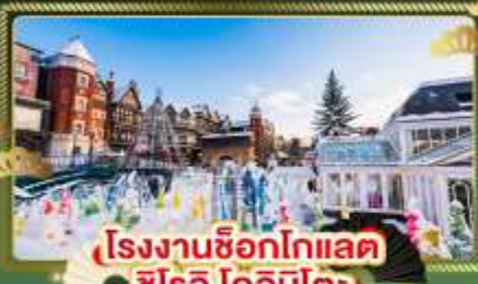
โรงงานช็อกโกแลต ชิโร โคอิจิตะ