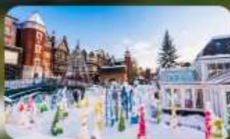
โรงงานช็อกโกแลต ชิโรอิ โคอิบิโตะ