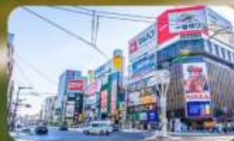
ซูจิกิโนะ