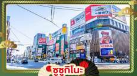
ชูชุกิโมะ