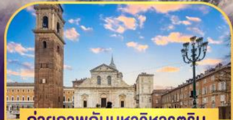
ถ่ายภาพกับมหาวิหารตูริน