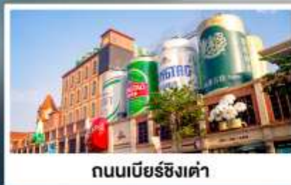
ถนนเบียร์ชิงเต่า