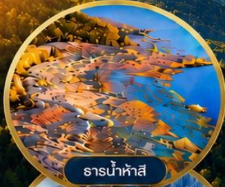
ธารน้ำห้ำสึ