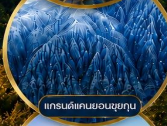
แกรนด์แคนยอนซูยกุน