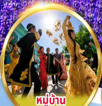
หมู่บ้าน วัฒนธรรมอุยกูร์

พิเศษ นั่งรถม้า + ซิมไอศกรีมอุยกูร์ ชมการแสดง