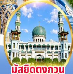
มัสยิดตงกอน