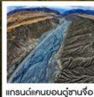
แกรนด์แคนยอนตู้ซานจือ