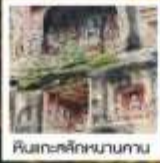
ศิลปะสถาปัตยกรรม