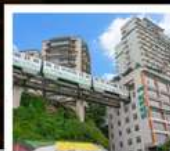
รถไฟกะลุดึก

ภูเขาถวงอู๋ซาน (รวมกระเช้า) • อุทยานหมีซานซาน หินแกะสลักหนานคาน • ชมรถไฟกะลุดึก หงหยาดัง • ถนนคนเดินเจียฟางเป่ย์