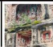
หินแกะสลักหนานคาน

PERIOD 1 : 13 - 17 ต.ค. 2569 PERIOD 2 : 17 - 21 ต.ค. 2569