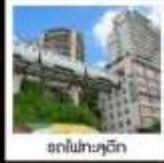
สถาปัตยกรรม