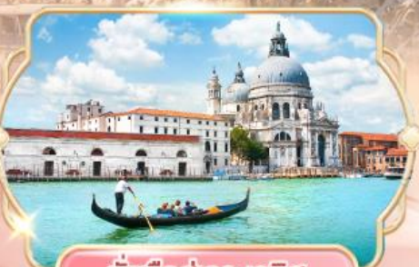
นั่งเรือสู่เกาะเวนิส