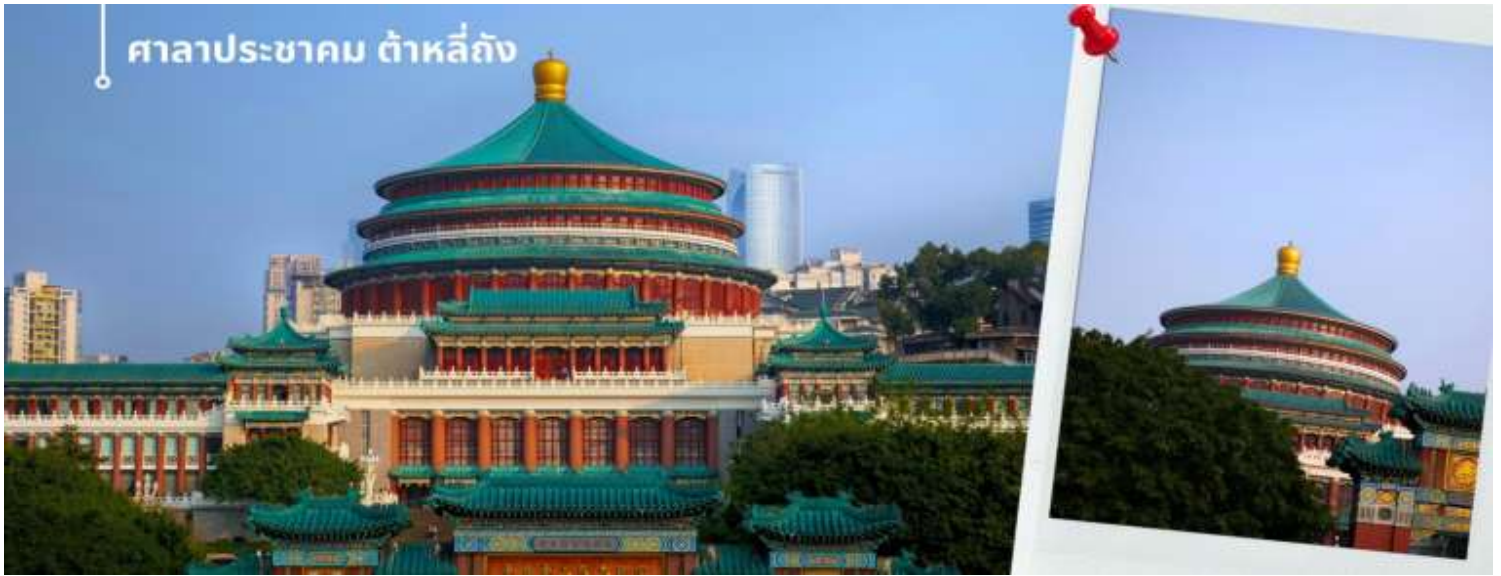
ศาลาประชาชน ต้าหลี่ถิง

นำท่านเดินทางสู่ ศาลาประชาชน (ด้านนอก) เป็นสถานที่หนึ่งในสัญลักษณ์ของเมืองฉงชิ่ง ด้วยสีส้มและรูปแบบการจัดวางอย่างโดดเด่นและลงตัว มีการผสมผสานของศิลปะในยุคราชวงศ์หมิงและราชวงศ์ชิงเข้าไว้ด้วยกัน ด้านหน้าจะเป็นลานกว้างในตอนเย็นและตอนกลางวันจะมีผู้คนจำนวนมากเข้ามารวมตัวกันทำกิจกรรม ไม่ว่าจะเป็นการเต้นแอโรบิค เดินเล่น ปิกนิก เดินชมแสงไฟยามค่ำคืน จัดนิทรรศการต่างๆ