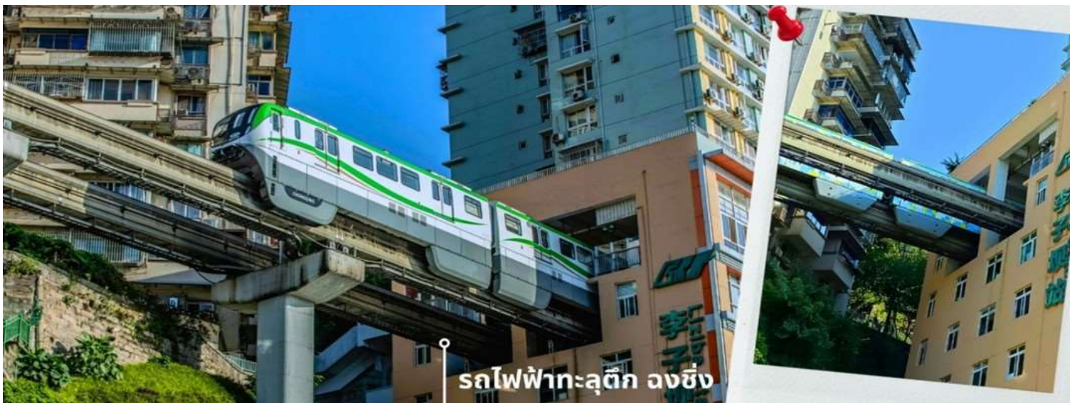
รถไฟฟ้าทะลุตึก ลงชิง

จากนั้นนำท่านนั่งรถไฟฟ้าทะลุตึก หรือ สถานี Liziba เป็นสถานีรถไฟฟ้าแบบขานชาลา สิ่งที่ทำให้สถานี Liziba มีชื่อเสียงไปทั่วโลกคือ “เส้นทางรถไฟที่วิ่งทะลุผ่านอาคารสูง 19 ชั้น” โดยมีระบบลดเสียงและแรงสั่นสะเทือน ทำให้ผู้ที่อาศัยอยู่ในตึกไม่ได้รับผลกระทบจากเสียงดังมาก กลายเป็นภาพอันน่าตื่นตาตื่นใจของผู้ที่มาเยือนซึ่งนักท่องเที่ยวที่เดินทางมาเป็นครั้งแรกผู้โดยสารบนขบวนรถไฟและผู้เข้าชมจากจุดชมวิวก็ต่างตื่นตะลึงไปตามๆกันกับการที่ได้เห็นรถไฟวิ่งทะลุตึกนี้ สถานี Liziba ได้รับการยกย่องให้เป็น 1 ในสถานที่สำคัญที่สะท้อนความเติบโตของจีนตลอด 70 ปี ซึ่งไม่ได้เกิดขึ้นโดยบังเอิญ รถไฟฟ้าทะลุตึกนี้คือตัวอย่างของความอัจฉริยะในการออกแบบการคมนาคมในเมืองภูเขาแห่งนี้ให้ท่านได้สัมผัสประสบการณ์กับการขึ้นนั่งบนรถไฟเพื่อผ่านทะลุตึกและเก็บภาพบรรยากาศ