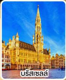
บริสเซลส์