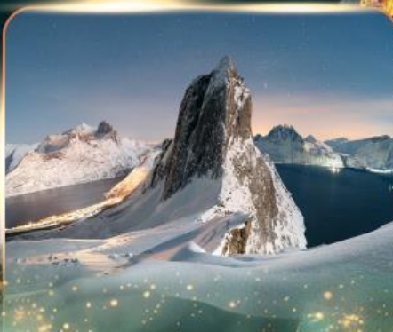
เกาะเซนญา