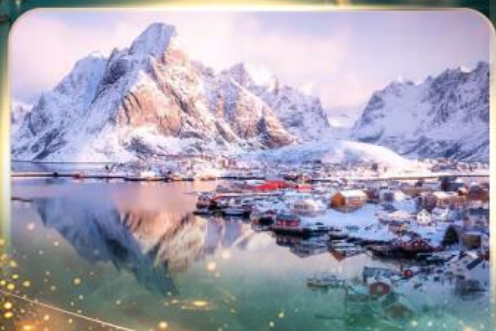
หมู่บ้านเรเนน