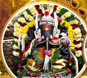
พระตรีศูล ปูเน่ (Trishul Pune)